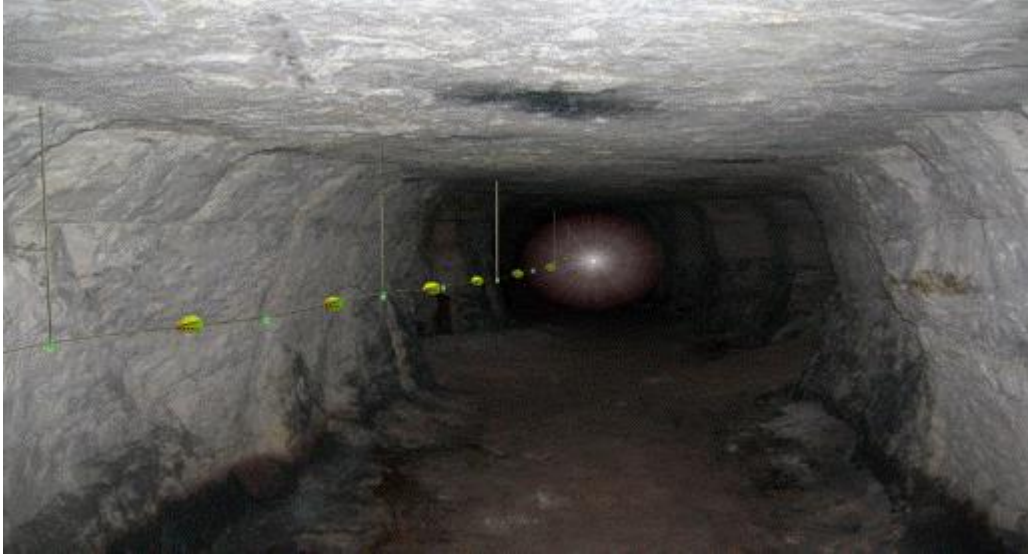
Şekil-1: Hayat hattı görünümü

yerüstüne çıkmalarını kolaylaştıran; yanmaya, kopmaya ve aşınmaya karşı dayanıklı bir hayat hattı kurulur (Şekil-1 ve Şekil-2). Bu hatlar acil durum planlarına uygun olarak yerleştirilir.